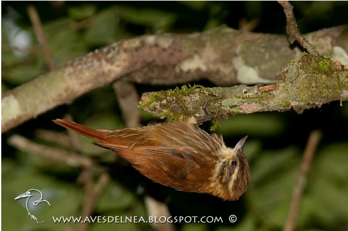
Figura 2. Picolesna Rojizo ( Xenops rutilans ) en Tacuaruzú, Misiones, Argentina.

ECOREGISTROS REVISTA - Artículo Nº 4 - 2011